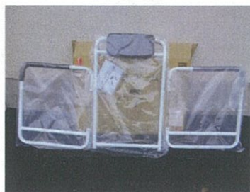
【組立トランク型自動ラップ式トイレ式】