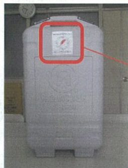
【携行用浄水器 レスキューアクア淡水仕様(PO-911)】