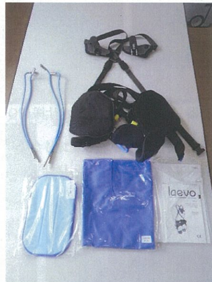
レイボ エクソスケルトン (アシストスーツ)

これは、令和 2 年度福井県介護職員負担軽減支援事業補助金(障がい福祉分野)の交付決定を受け、職業病とも言われる腰痛防止のために施設で購入したものです。