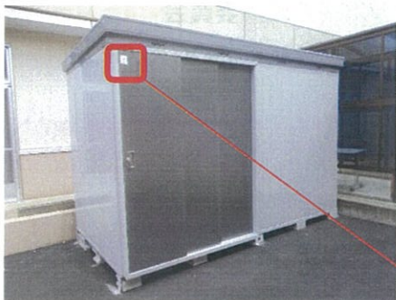
【防災用倉庫(断熱物置)】