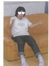
♪踊っているみたいですね♪

利用者の皆さまは、それぞれ障害やご病気をお持ちですが、動ける範囲で身体を動かしています。