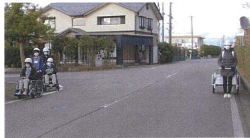
【車いすとリヤカーを使用】

災害対策マニュアル(平成29年2月1日)の第2章の4「施設外の集合場所への避難誘導」に基づき、災害により現施設が倒壊の恐れがある時を想定し、その際、利用者の方々に指定避難所まで安全に避難させるためのルートを確認することにより、いざという時の備えとすることを目的としています。