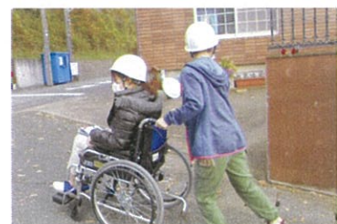
【坂道での車いす誘導】